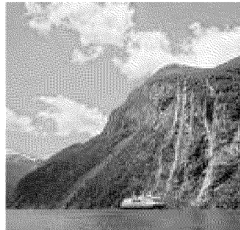
In navigazione lungo i fiordi

• Magia di Marrakech. Dal fascino di piazza Jemaa el Fna ai silenzi dei giardini, dal souk al relax di un hammam. Partenze dall'8 al 29 aprile, tre notti in mezza pensione presso l'hotel Atlas Asni, da 455 euro. Info: Last Minute Tour, tel. 011 95438340, www.lastminutetour.com • In vacanza nel trullo. Aria di campagna tra i ciliegi in fiore della Tenuta Monacelle, a Selva di Fasano, in provincia di Bari. All'interno del trullo Azalea, trasformato in spa, si scopre il massaggio alla ciliegia. Dal 23 al 25 aprile, due notti, due cene e un pranzo, da 225 euro a persona. Info: Tel. 080-9309942 www.tenutamonacelle.com