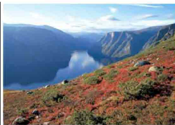
Insenature profonde disegnano la costa

Il vocabolo norvegese "fjord" è stato adottato da molte lingue e designa le antiche valli profonde valli create durante l'era glaciale e ora sommerse dal disgelo. I numerosi fiordi norvegesi creano una miriade di insenature all'interno della costa e sono molto diversi tra loro: in alcuni vi sono terre coltivate che si spingono praticamente fino alla riva, in altri, pareti di montagne rocciose si tuffano a picco nel mare. Durante l'estate le navi Hurtigruten navigano all'interno del Trollfjord , vicino alle Lofoten, e nel Geirangerfjord , vicino a Alesund. Il Trollfjord è così stretto che è quasi possibile toccare le montagne da entrambi i lati della nave. Il Geirangerfjord è uno dei fiordi più scenografici e dal 2005 è tutelato dall'Unesco come patrimonio naturalistico dell'umanità.