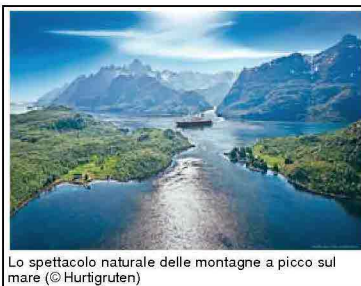
Lo spettacolo naturale delle montagne a picco sul mare

scali in una settimana: importanti città come Trondheim e Tromsø ; la regione dei fiordi, inclusa dall'Unesco nel Patrimonio dell'Umanità; piccoli villaggi di pescatori; le pittoresche isole Lofoten con le montagne a strapiombo sul mare e poi Honningsvåg , la cittadina più vicino a Capo Nord, il punto più settentrionale del continente europeo e tappa mitica per i viaggiatori di ogni epoca. La rotta del Postale attraversa la linea del Circolo Polare Artico , superata la quale costeggia le "Terre delle luci" che regalano straordinari fenomeni come il Sole di Mezzanotte in estate e l'auroa boreale nei mesi invernali.