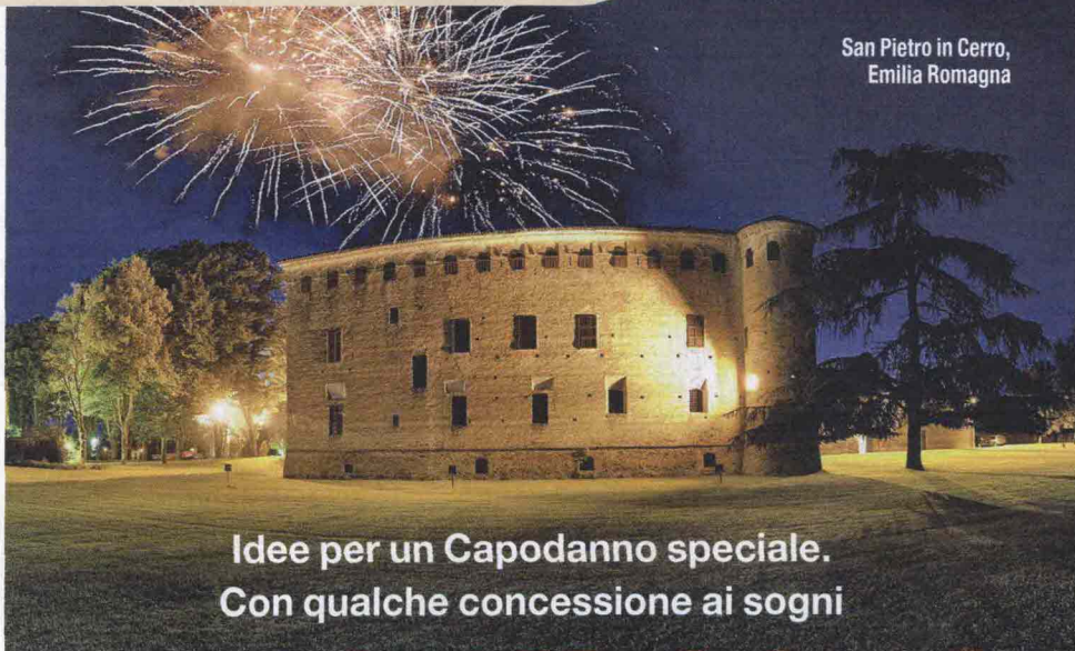
San Pietro in Cerro, Emilia Romagna

Per apprezzare la zona con spirito di autentica naturalezza,