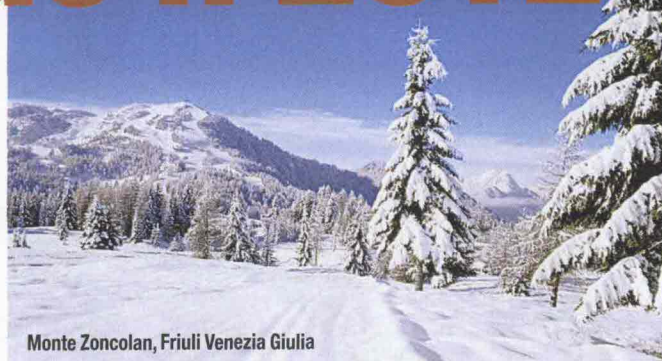
Monte Zoncolan, Friuli Venezia Giulia

Il mare calmo, il litorale piatto e sabbioso, la pineta lungo la costa: il paesaggio intorno a TIRRENIA è il tipico ambiente della Versilia , accogliente e rilassante anche, e soprattutto lontano dall'affollata stagione estiva. Qui, tra Pisa e Viareggio , le passeggiate sulla spiaggia e nella pineta sono solo una delle attività possibili. Di grande interesse ambientale è il parco naturale di Migliarino-San Rossore-Massaciuccoli. Chi ama le città d'arte,