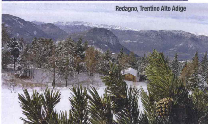
Redagno, Trentino Alto Adige

elfi, carica la slitta per attraversare i cieli di tutto il mondo. Il viaggio, però, non incanterà solo i bambini. La natura della Lapponia è una scoperta unica, insieme alle tradizioni del popolo Sami. Un'escursione di notte in motoslitta o, meglio ancora, su una slitta trainata dagli husky nel silenzio della foresta imbiancata, regala emozioni senza pari. Se, poi, la notte è l'ultima dell'anno, la magia è completa. Viaggio di 6 giorni: 1.755 € a persona.