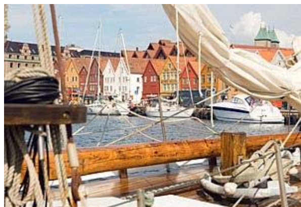
Bergen, il quartiere di Bryggen